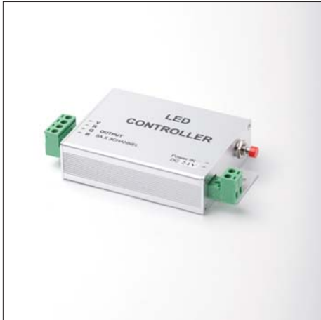
RGB - drukknop RGB - push button