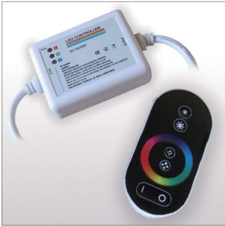
RGB controller - draadloos RGB controller - wireless