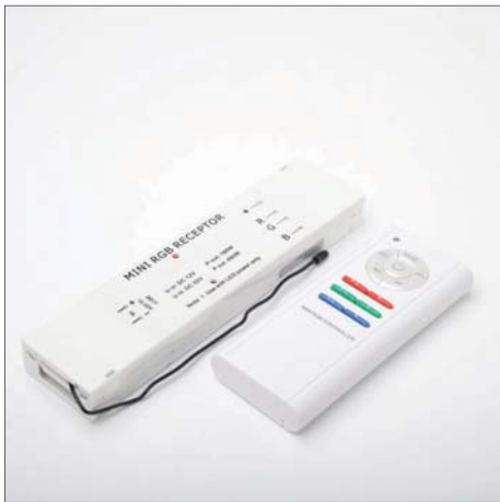
RGB - draadloos RGB - wireless