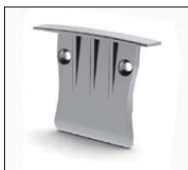
46290334 Alu. eindkap Alu. end cap