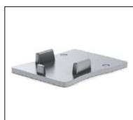
46290324 Alu. Eindkap Alu. End cap