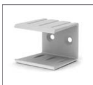
46290325 Montagebeugel Mounting bracket