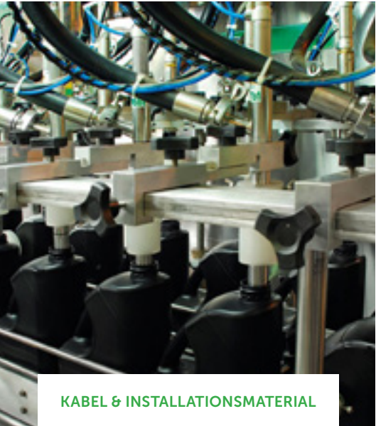
KABEL & INSTALLATIONSMATERIAL

LED-BELEUCHTUNG & DYNAMISCHES LICHTMANAGEMENT