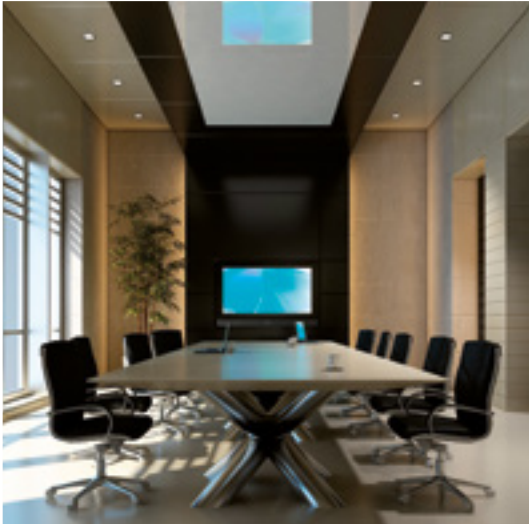
AUDIO & VIDEO PRODUKTE